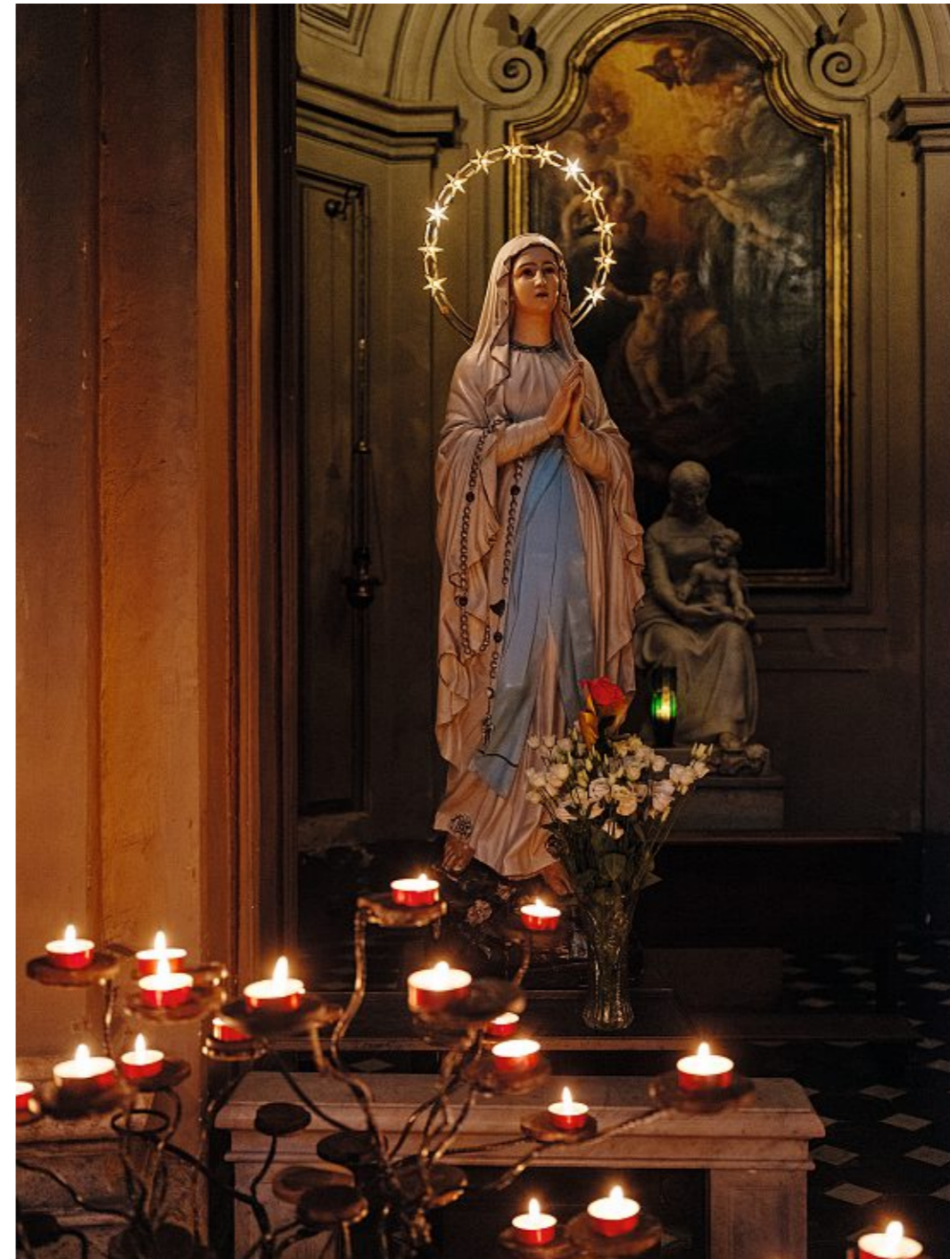
Kann Maria Pizza und Gnocchi vermehren?

Theologen sagen, das Problem für den Vatikan sei nicht allein die wachsende Zahl von Menschen, die Maria gesehen haben wollen. Es sei vor allem die Unruhe, die solche Erscheinungen in Gemeinden auslösen, und die Medienhysterie. Die katholische Kirche ist eine alte Institution. Sie mag keine Aufregung. Und behält gern die Kontrolle – auch über das Bedürfnis der Menschen nach Wundern. Gibt es Wunder? Beweisen sie Gottes Existenz? Für die Kirche sind solche Fragen heil-