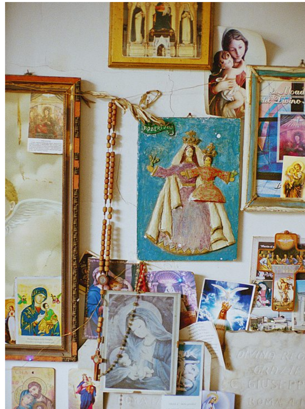
Manche sehen in Maria eine Revolutionärin, ein Vorbild für eine arme, widerspenstige Kirche.

Dann studiert sie wie eine Kriminalistin die Berichte der Menschen, die Maria gesehen haben wollen, sichtet Aussagen von Zeugen, hört sich die Einschätzungen der Kirchenleitung vor Ort an, vergleicht ihre Recherchen akribisch mit historischen Dokumenten von Marienerscheinungen. In der Regel kommt sie dann schon zu dem Ergebnis, dass die Erscheinung nicht echt ist. Weil Marias vermeintliche Aussagen der Überlieferung in der Bi-